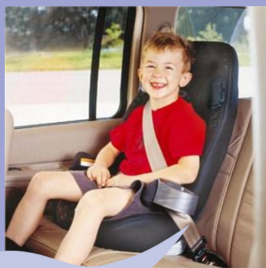
Asiento "BOOSTER" -con respaldar-